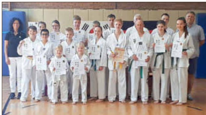
Trainerin, Schüler der Taekwondoabteilung der ASG, Prüfer