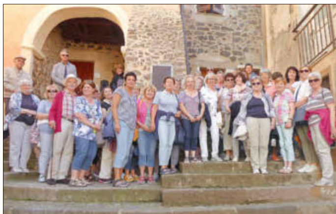
Auf den steilen Treppen in Castelsardo

und die Hauptstadt Cagliari mit der Bastion auf einem Kalksteinhügel gelegen, und dem Castello-Viertel, als Wahrzeichen der Stadt. Einige Wein- und Olivenverkostungen und die Probe des berühmten Malvasia Weines rundeten den kulinarischen Teil der Reise ab.