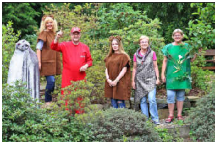
So bunt wie die Kostüme der Mitspieler ist auch der Festverlauf.