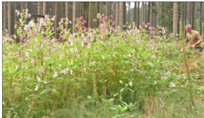
Dirk Vohl, Ortsbürgermeister

Es wäre wünschenswert, wenn sich viele Grundstücksbesitzer sowie die Nachbargemeinden zukünftig beteiligen, weil nur so langfristig Erfolge in der Beseitigung erzielt werden können.