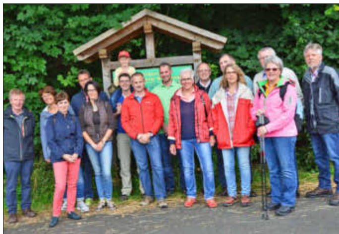
Wanderer des CDU Gemeindeverbandes Altenkirchen

Dort wurden dann neben gekühlten Getränken auch gegrillte Würstchen und Salate angeboten.